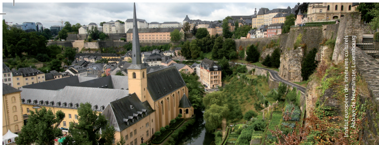
Institut européen des itinéraires culturels Abbaye de Neumünster, Luxembourg